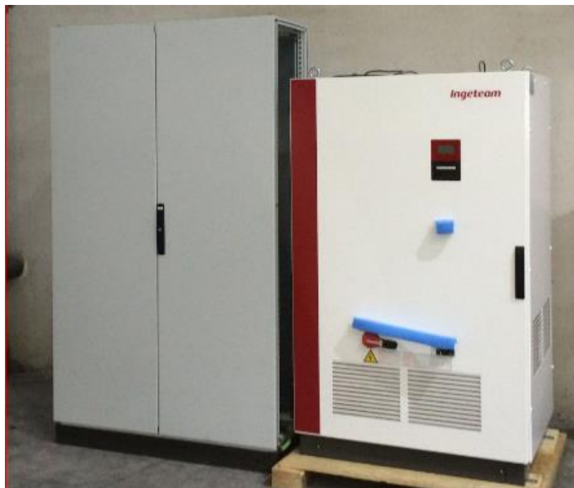
Foto Inversor FV