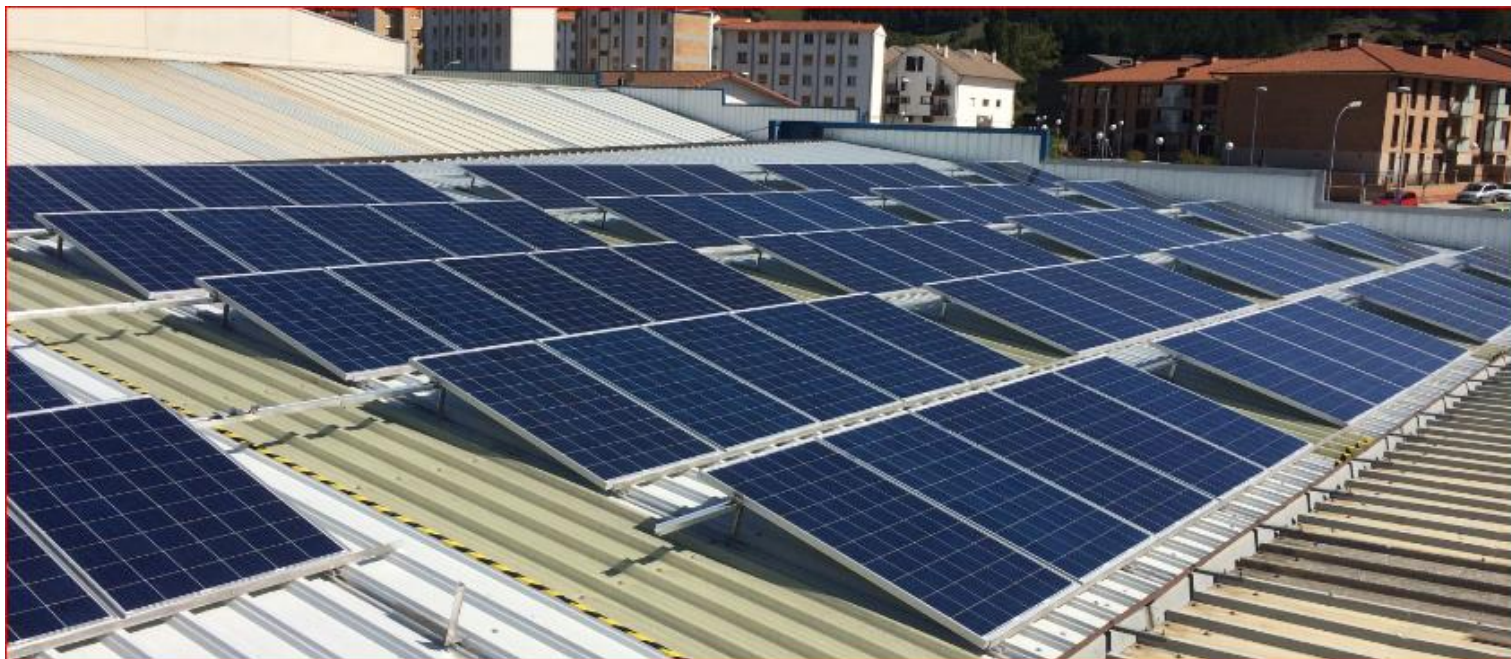
Foto Paneles FV sobre cubierta.