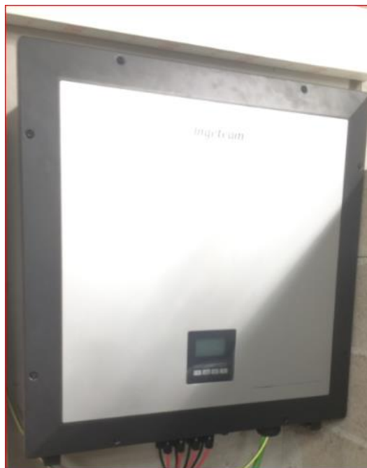
Foto Inversor FV