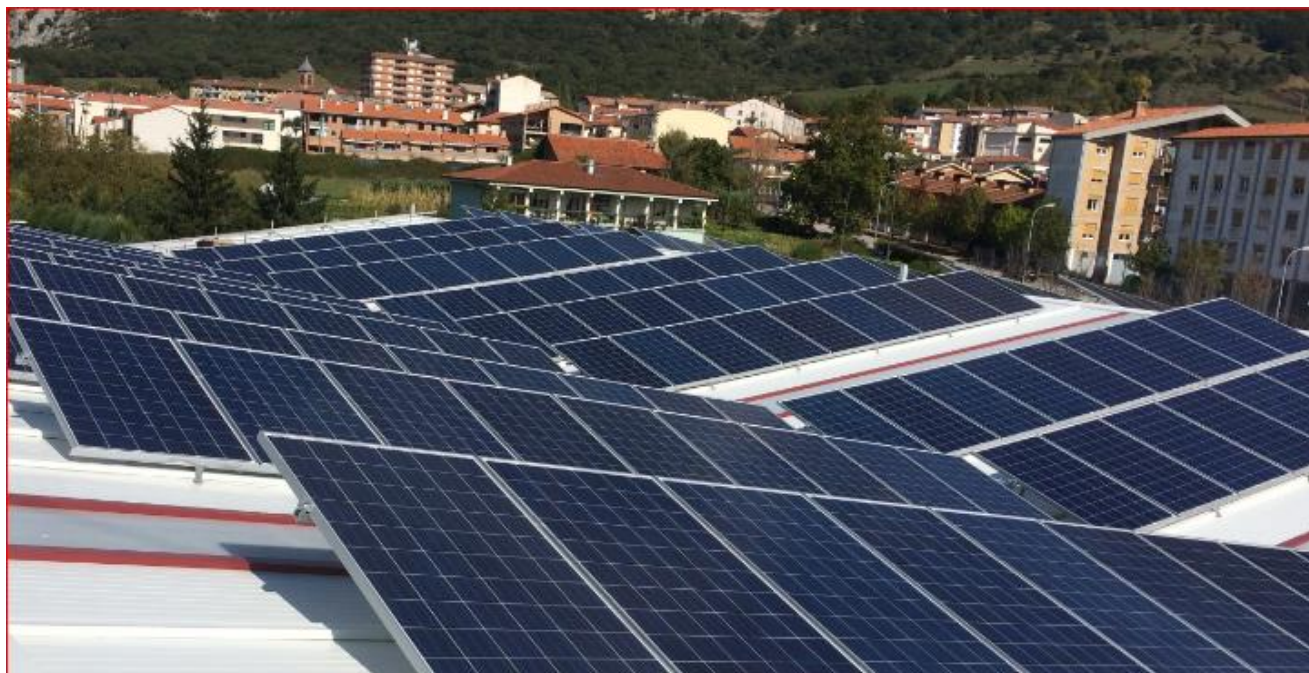
Foto Paneles FV sobre cubierta.