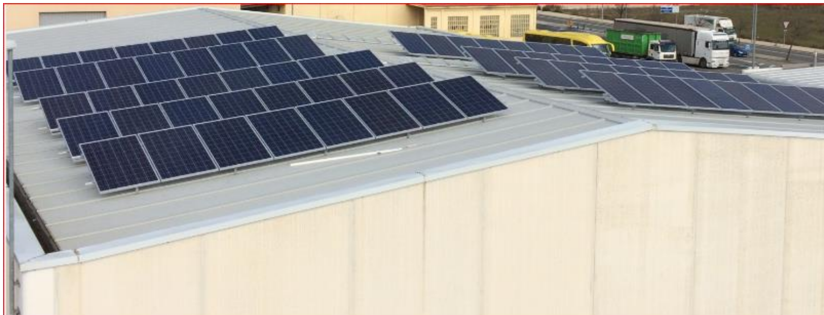
Foto Paneles FV sobre cubierta.